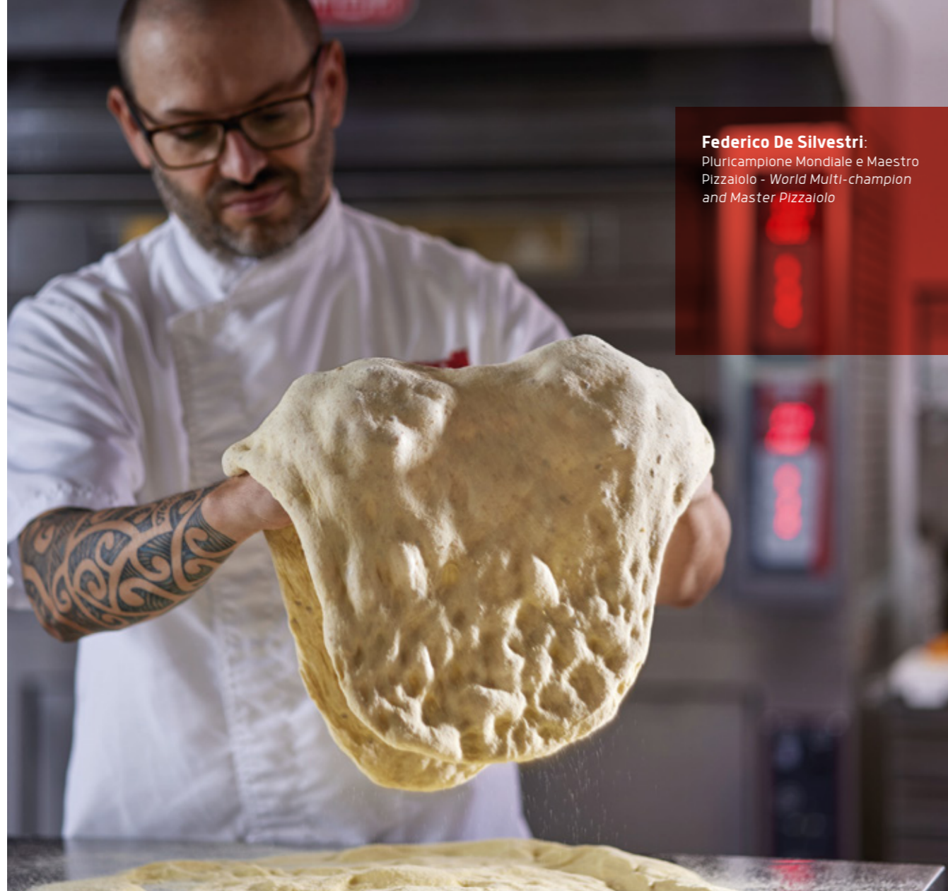
Federico De Silvestri: Pluricampione Mondiale e Maestro Pizzaiolo - World Multi-champion and Master Pizzaiolo