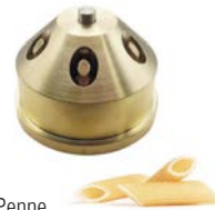
Penne Necessita del kit coltello inclinato per penne Requires kit knife inclined for penne