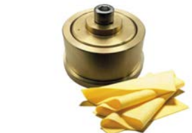
Sfoglia regolabile larghezza mm 173 - trafile ø 59/75 mm 284 - trafile ø 110 Adjustable sheeter Sheet width mm 173 - die ø 59/75 mm 284 - die ø 110