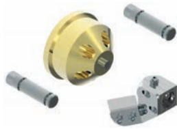
Kit per trafile penne opzionale, trafile a parte Optional kit for "penne" die (die not included)