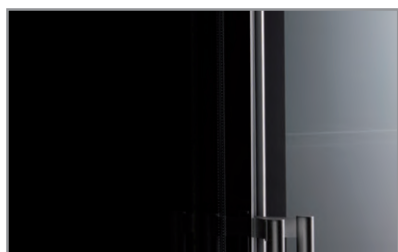
Porta a sfioro senza cornice Full glass frameless door

Dati indicativi e variabili a seconda dei diversi packaging / Variable data depending on the different packaging