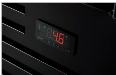
Termostato elettronico Electronic thermostat